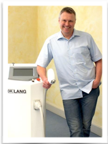
Bild: Einer meiner 808 nm DiodenLaser zur Haarentfernung.

Laserlicht einer bestimmten Wellenlänge (Lichtfarbe) kann tief unter die Hautoberfläche dringen, „findet“ sein Ziel automatisch und zerstört das Haar mit einem Hitzeimpuls, der erst im Haarfollikel entsteht.