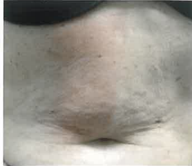
rechte Bauchseite direkt nach dem RF-Needling

Bilder zeigen nur ästhetische Indikationen