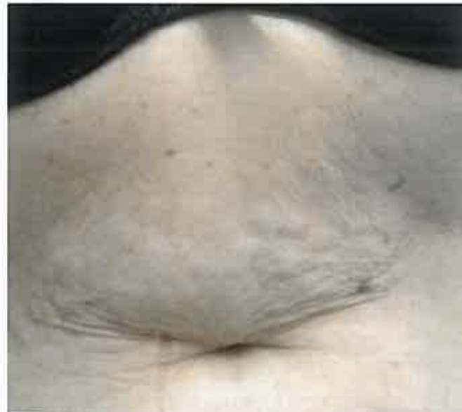
und 6 Wochen nach der Behandlung