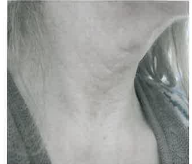
Hals vor RF-Needling